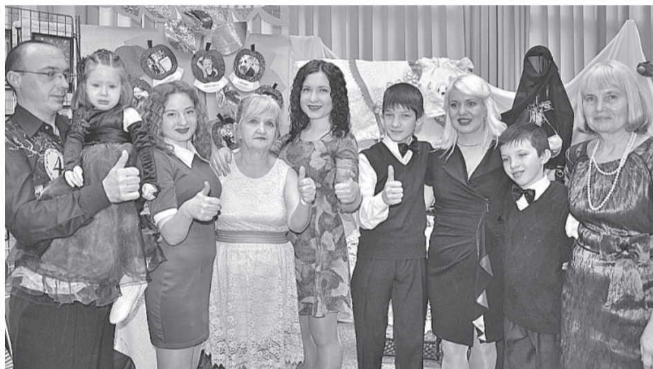
Сапрыкины всегда готовы петь, танцевать, весельем и добротой других поддерживать.