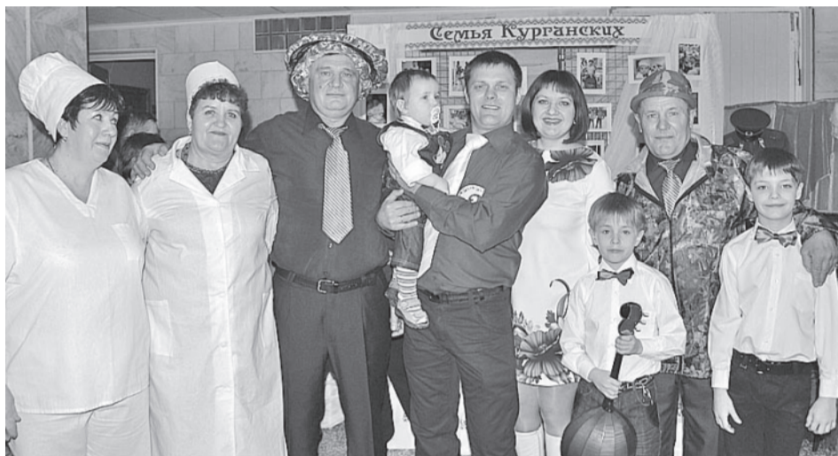
Курганские и в спорте, и в творчестве, и в домашнем хозяйстве – везде вместе.